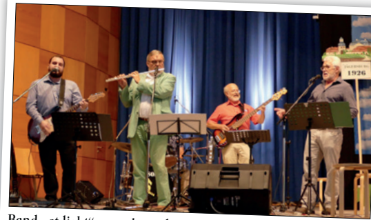
Band „at light“ – probte schon vor 40 Jahren in der Konferenzhalle