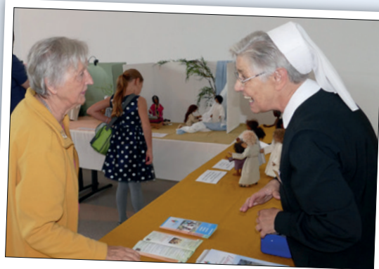
S. Hannelore Träger hat die Egli-Figuren angefertigt und für die Ausstellung und den Egli-Figurenkalender gestellt