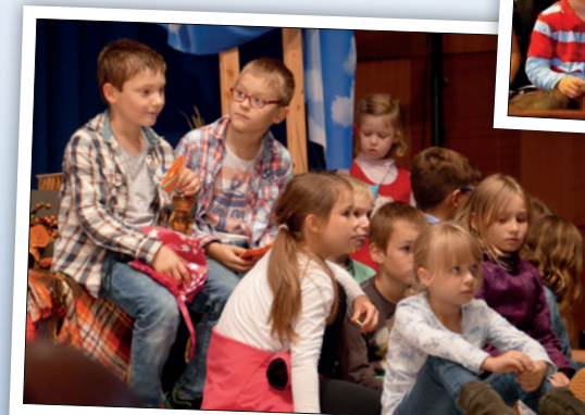
Kinder von heute – Erwachsene von morgen