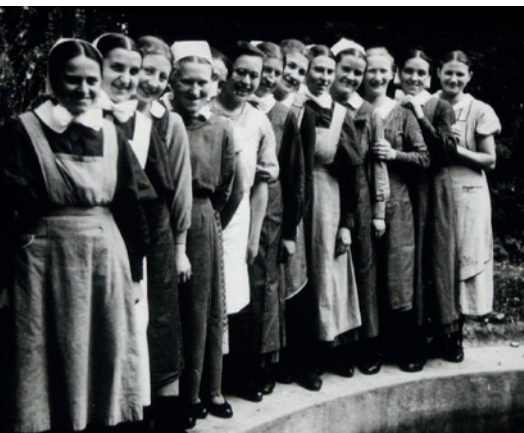
Jägersburger Schwestern am Brunnen