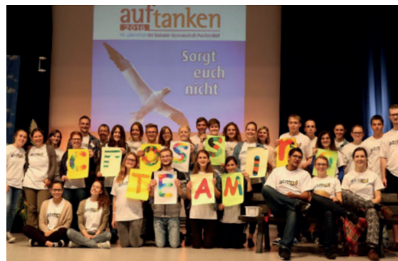
alte und neue crossing!-Teamler

In der Woche vor dem Jahresfest steigt die Spannung für das Vorbereitungsteam der Diakonie-Gemeinschaft. Denn seit vier Jahren werden die Stühle in der Halle, die Bühne und vieles andere, erst am Tag vor dem Jahresfest vorbereitet. Das machen ehemalige crossing!-Teamler mit großem Engage-